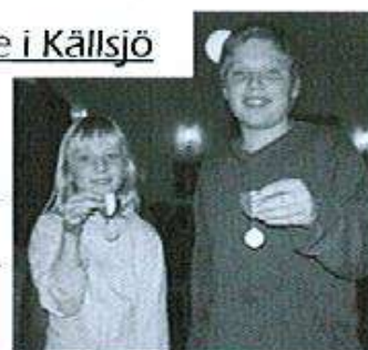
Bild från skytteavslutningen i Källsjö där alla deltagare fick sina priser

Ett gediget arbete läggs ner av ledare för att stötta och hjälpa skyttarna