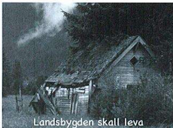
Landsbygden skall leva