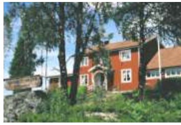
(7) I vår vackra Bygdgård anordnas kalas, studiecirklar, möten etc.