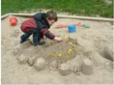
(2) För oss på Förskolan Solen är varje barn unikt och fullt utav resurser och erfarenheter.