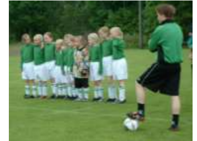
(5) Ett stort utbud av idrottsaktiviteter så som fotboll, boule, tennis, orientering etc. för både stora som små.