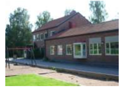
(6) Fagerreds skolan är en liten trivsamt skola med elever från 6-12 år. Fritidshem bedrivs...