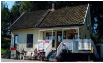
(1) Fagerreds affären är en genuin lanthandel sedan 1899.